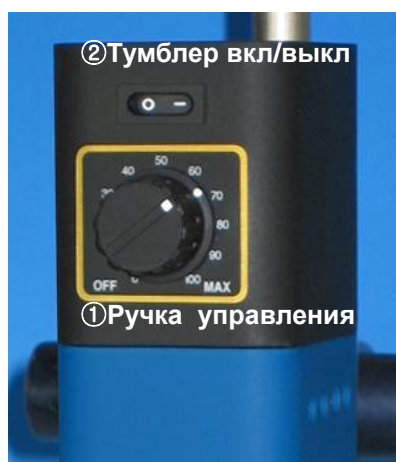
<Рис-3 HG-15A Аналоговый блок управления>