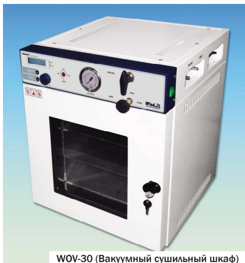
WOV-30 (Вакуумный сушильный шкаф)