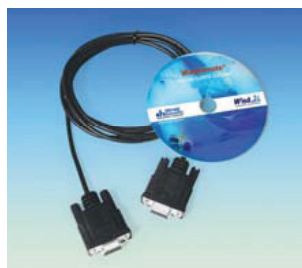
Кабель для RS232 и ПО для подключения к ПК