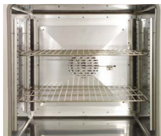
Камера сушильного шкафа с вентилятором принудительной конвекции